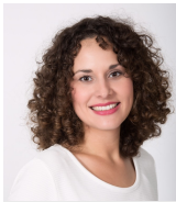
Sandra Liedtke Pressekontakt (derzeit in Elternzeit)